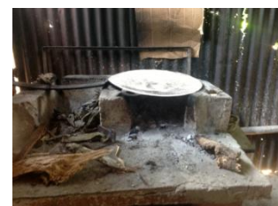
Un "poyetón", 2013

Sobre la salud pública: La Contaminación de Aire en el Hogar (CAH) es responsable de pérdidas económicas equivalentes a alrededor del 1% del Producto Interior Bruto (PIB) de Guatemala. Se atribuyen alrededor de 5200 muertes a la CAH en Guatemala en 2010, 1775 de ellas niños menores de 5 años. Estos impactos negativos y su posible disminución mediante el uso de estufas y combustibles limpios siguen siendo desconocidos para la mayoría de hogares.