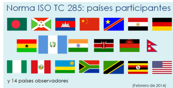
Países participantes en ISO TC /285 (estufas y combustibles limpios)

No existe certificación ni requisitos de calidad para las estufas fabricadas en el país. Sin embargo, la Comisión Guatemalteca de Normas (COGUANOR) acaba de entrar oficialmente en el Comité Técnico de la ISO 285 para participar en los debates formales sobre las normas para estufas limpias.