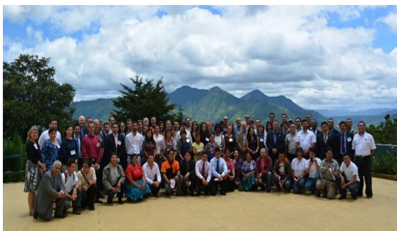
Taller de consulta de las partes interesadas, Antigua Guatemala, 9-10 de julio de 2013